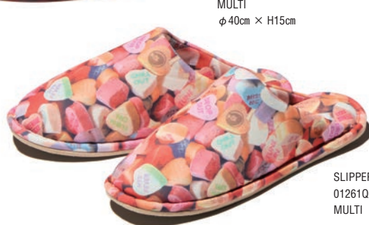
SLIPPERS 01261QG11 / ¥5,940 MULTI