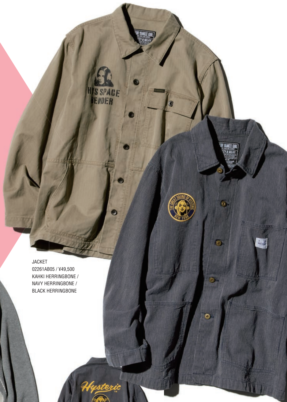
JACKET 02261AB05 / ¥49,500 KAHKI HERRINGBONE / NAVY HERRINGBONE / BLACK HERRINGBONE

HYSTERIC GLAMOURが得意とする音楽モチーフのグラフィック。ファンの間でも揺るぎない支持を誇り、最新のコレクションでは例年以上に多彩なアイテムにそれが登場。ヘッドフォン姿のHYSTERIC WOMAN、グラムロックをイメージしたデザイン、人気絶大のGUITAR GIRLなど、アナタの推しは？