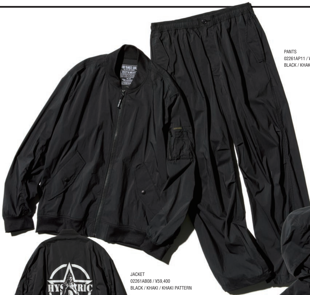
PANTS 02261AP11 / ¥52,800 BLACK / KHAKI / KHAKI PATTERN