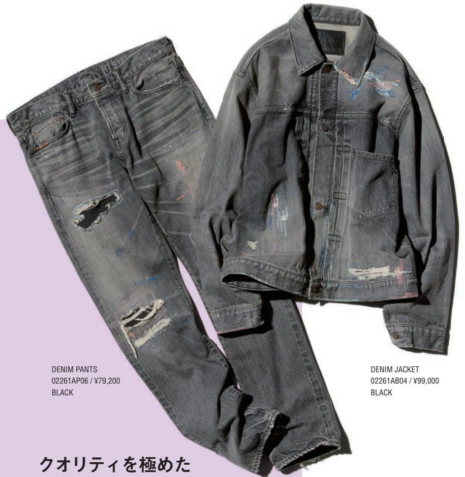
DENIM PANTS 02261AP06 / ¥79,200 BLACK