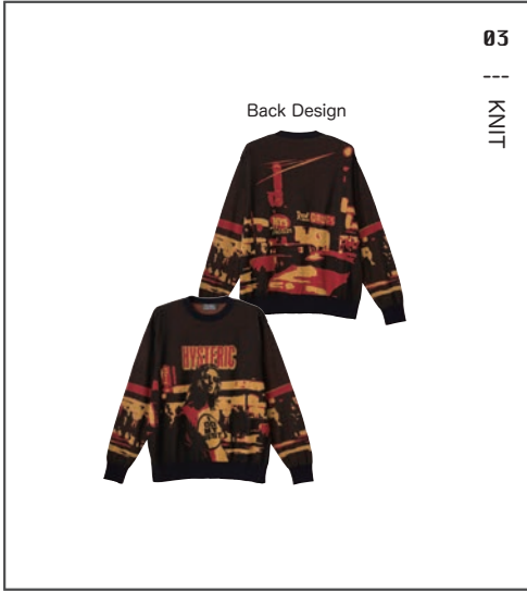
03 || KNIT