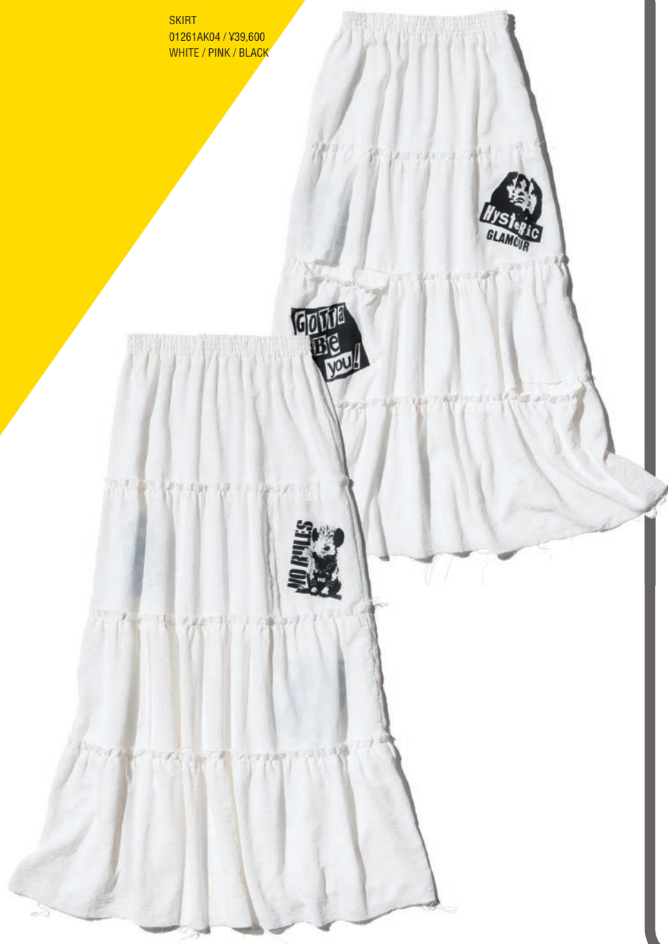
SKIRT 01261AK04 / ¥39,600 WHITE / PINK / BLACK