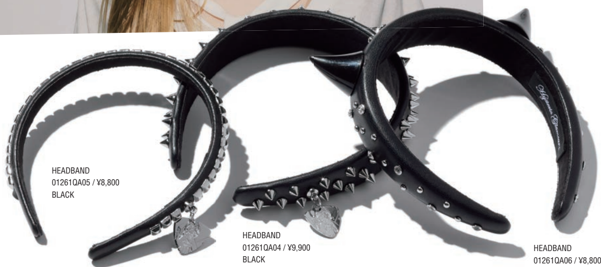
HEADBAND 01261QA05 / ¥8,800 BLACK