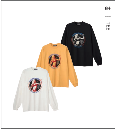
04 || TEE