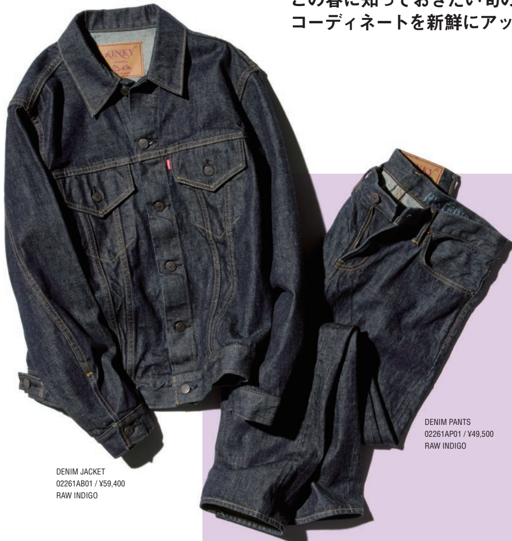
DENIM JACKET 02261AB01 / ¥59,400 RAW INDIGO

ストリートで起こっている注目トレンド、ブランドが打ち出す独自の提案など、この春に知っておきたい旬のファッションキーワードをコンパイル。コーディネートを新鮮にアップデートできるアイテム選びのヒントがここにある。