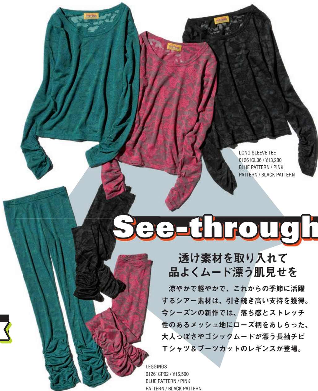
LONG SLEEVE TEE 01261CL06 / ¥13,200 BLUE PATTERN / PINK PATTERN / BLACK PATTERN

Z世代をメインに数年前から流行しているナップサック。実用性や手に取りやすい価格はもちろん、軽快な雰囲気やヌケ感の演出にも有効なのが選ばれている理由。あくまでもアクセサリ感覚のバッグと捉えて、あまり荷物を入れすぎないのが今どきのポイント。