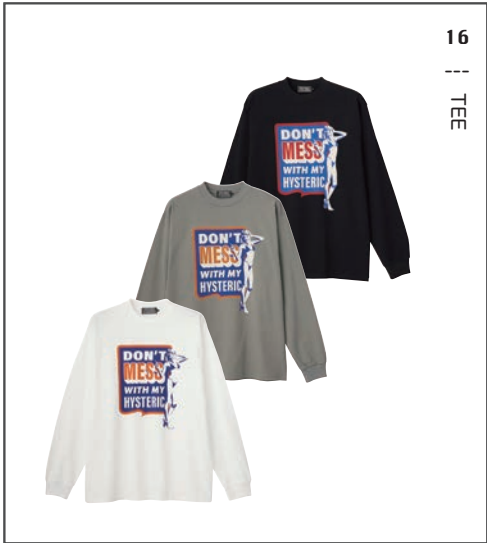
16 || TEE

01 HOODIE 02261CF02 / ¥44,000 BLUE PATTERN / GRAY PATTERN / BLACK PATTERN