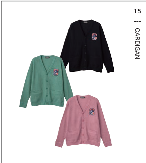
15 || CARDIGAN