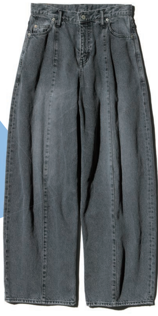
DENIM PANTS 01261AP01 / ¥48,400 BLACK / INDIGO

ワイドパンツ全盛が長く続き、シルエットの美しさが一段と重要視されるように。そうした今、勢力を急拡大しているのが、丸みのある立体的なフォルムを描くカーブラインの一本。脚線をカバーしてスタイルアップ効果も望めるとあって、オシャレの心強い味方に。