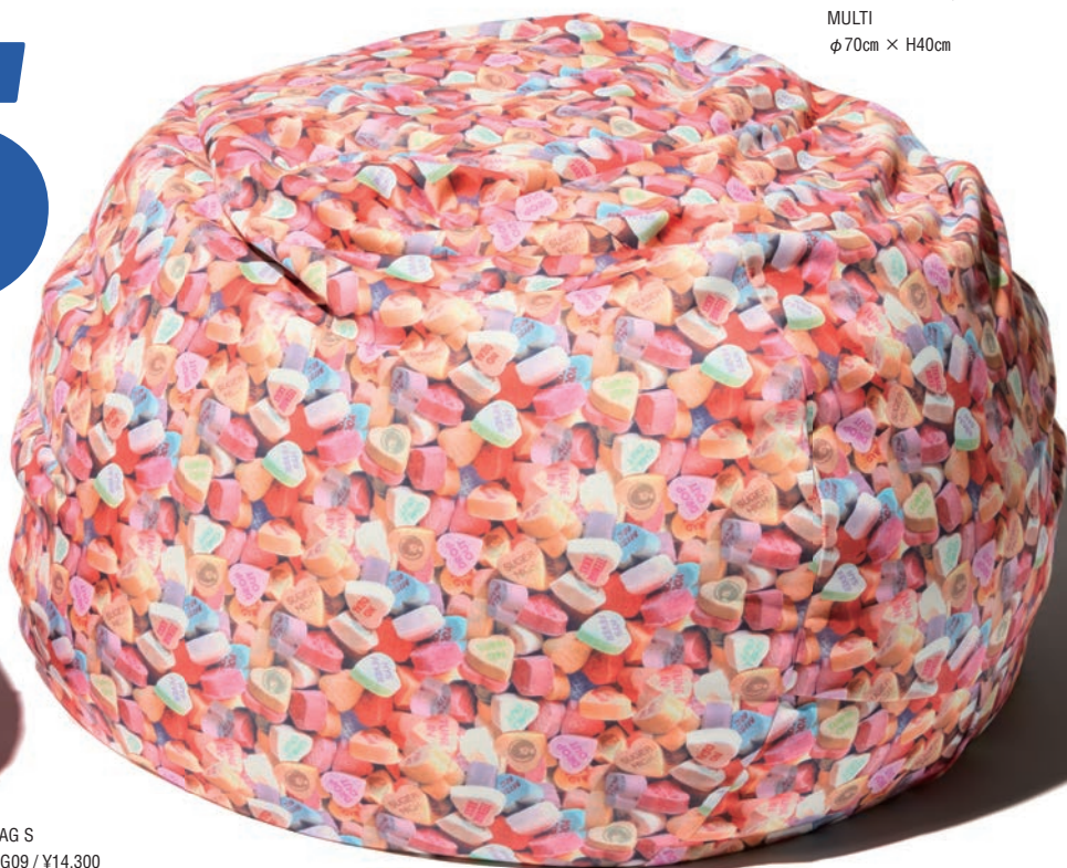
BEAN BAG L 01261QG10 / ¥39,600 MULTI φ 70cm × H40cm