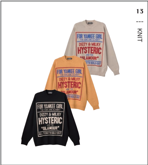
13 || KNIT