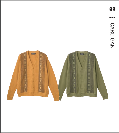
09 || CARDIGAN