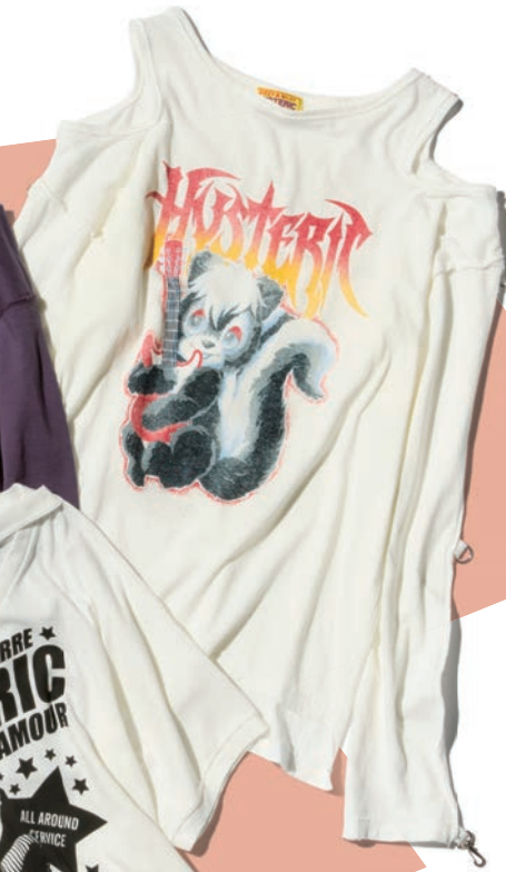
LONG SLEEVE TEE 01261CL03 / ¥24,200 WHITE / GRAY / BLACK