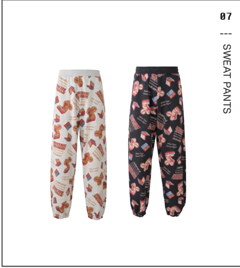
07 || SWEAT PANTS