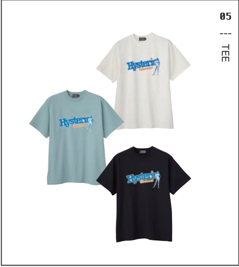
05 || TEE