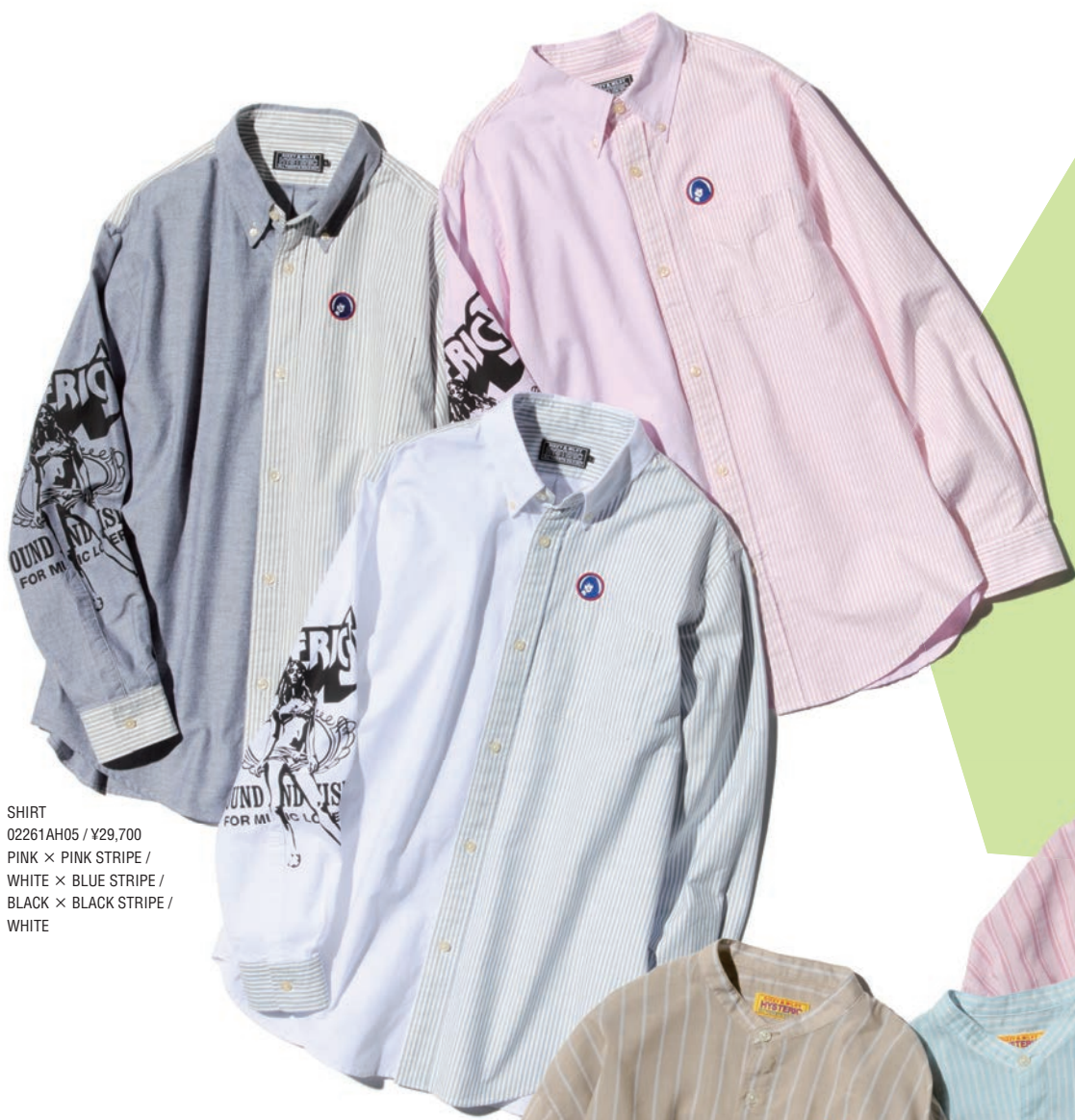
SHIRT 02261AH05 / ¥29,700 PINK × PINK STRIPE / WHITE × BLUE STRIPE / BLACK × BLACK STRIPE / WHITE