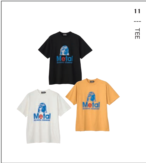
11 || TEE