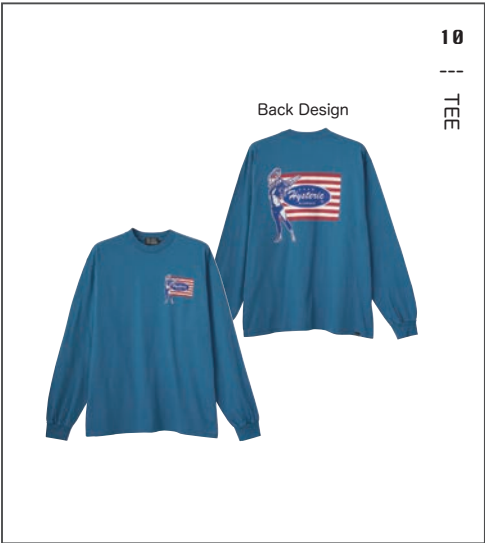
10 || TEE