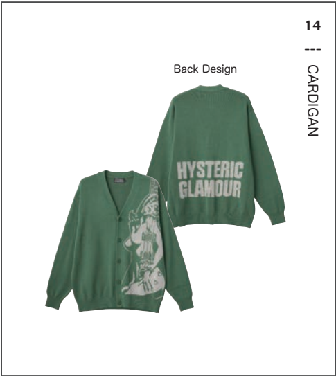
14 || CARDIGAN