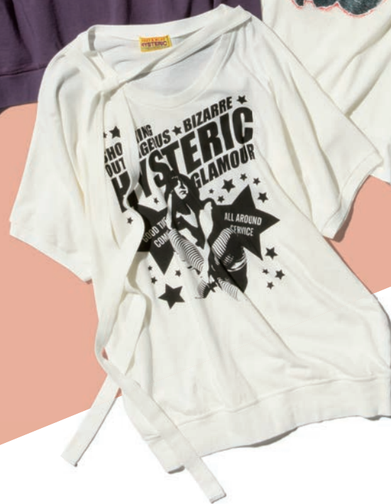
TEE 01261CT01 / ¥16,500 WHITE / GRAY / BLACK