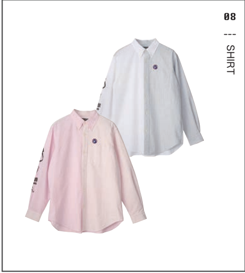
08 || SHIRT