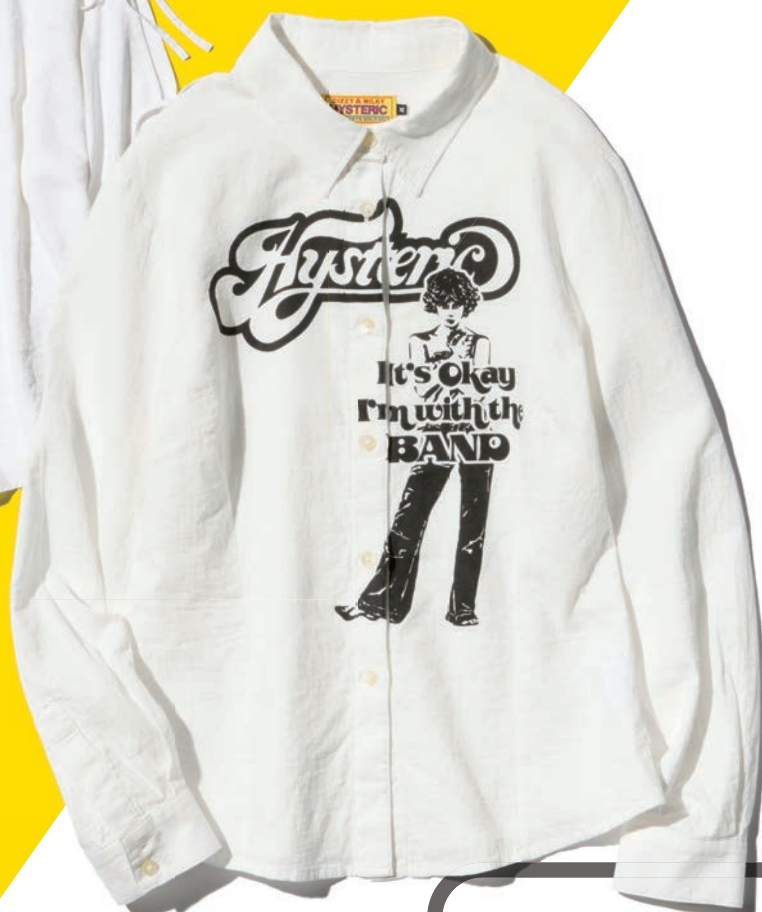
SHIRT 01261AH01 / ¥28,600 WHITE / BLACK