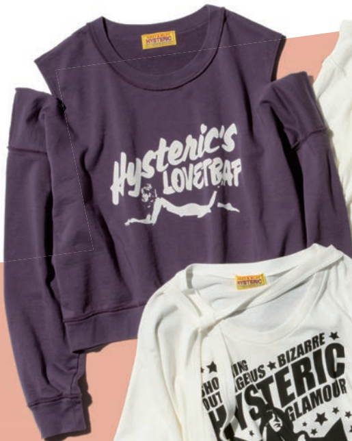
SWEAT 01261CS01 / ¥22,000 PURPLE / BEIGE / BLACK