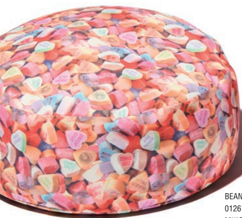
BEAN BAG S 01261QG09 / ¥14,300 MULTI φ 40cm × H15cm