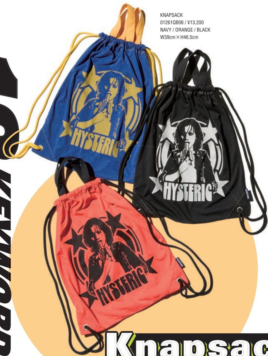
KNAPSACK 01261QB06 / ¥13,200 NAVY / ORANGE / BLACK W39cm × H46.5cm