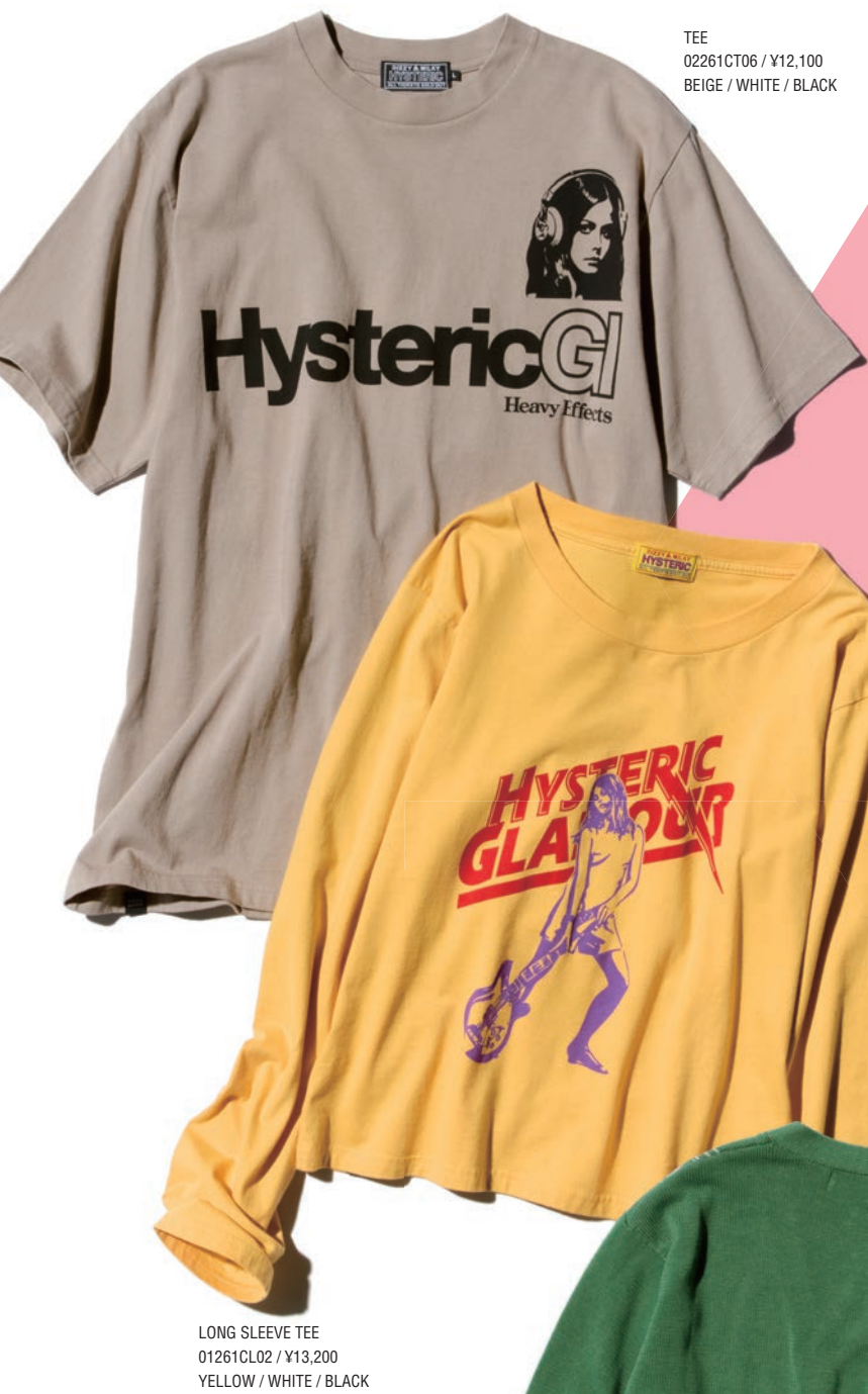
TEE 02261CT06 / ¥12,100 BEIGE / WHITE / BLACK