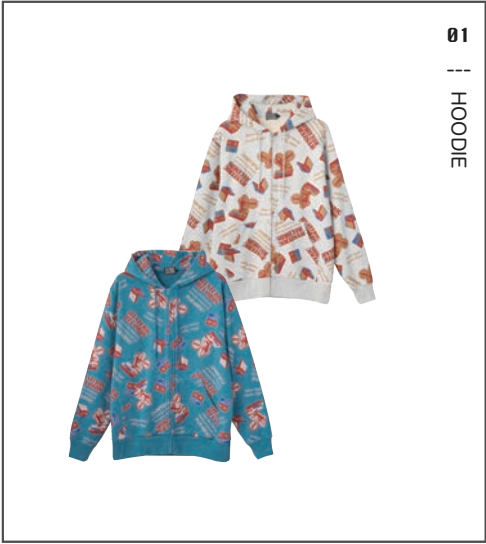
01 || HOODIE