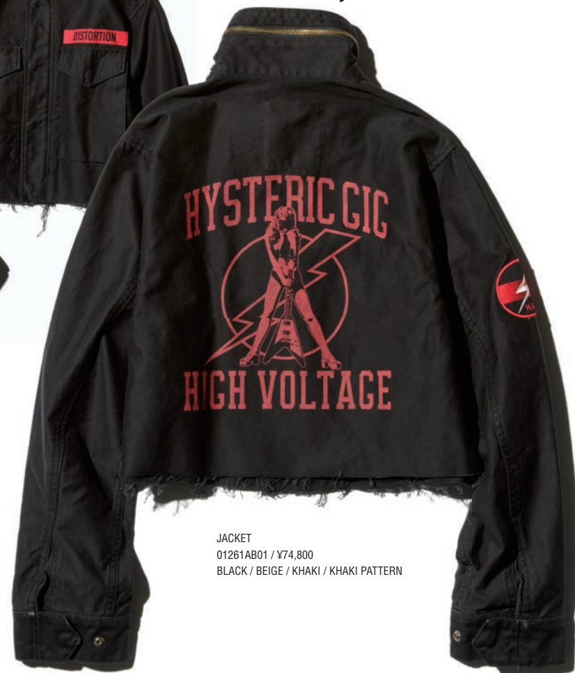
JACKET 01261AB01 / ¥74,800 BLACK / BEIGE / KHAKI / KHAKI PATTERN