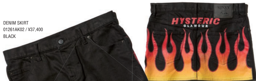
DENIM SKIRT 01261AK02 / ¥37,400 BLACK

この春も健在のデニム人気。なかでも圧巻のクオリティを誇るジャパンメイドのそれは、価値ある逸品としてこれまでも増して強く求められる対象に。HYSTERIC GLAMOURでは糸から作り上げたモデルや高度な加工モノなど、よりプレミアムなセットアップを提案。