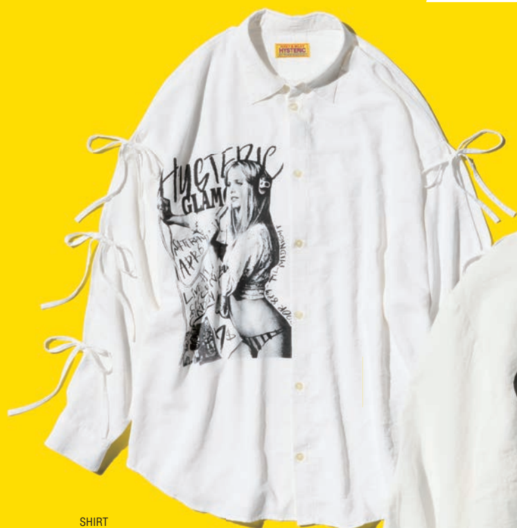
SHIRT 01261AH03 / ¥39,600 WHITE / PINK / BLACK