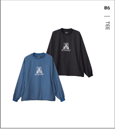
06 || TEE