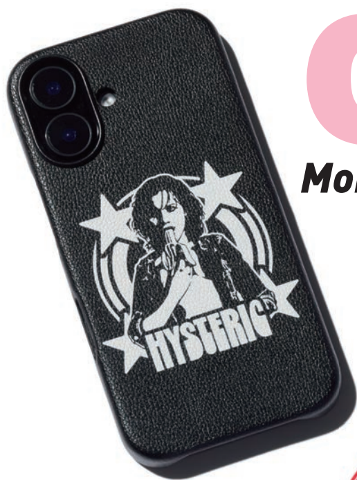
i Phone CASE 02261QG04 / ¥6,930 BLACK i Phone17 / i Phone17pro