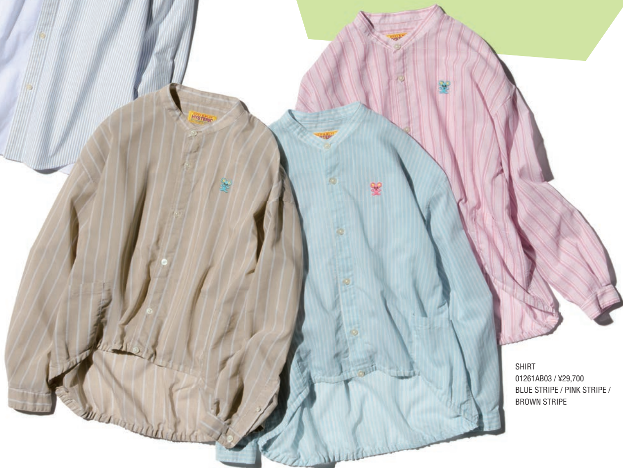
SHIRT 01261AB03 / ¥29,700 BLUE STRIPE / PINK STRIPE / BROWN STRIPE

今年の春夏は、定番柄であるストライプに改めて脚光が。暑くなる時季に、スッキリとした爽やかで涼しげな印象を添えられるのも魅力のひとつ。たとえば紹介のボタンダウンやシャツブルゾンは、トレンドのプレッピーなどスクールスタイルとも最高の相性を発揮。