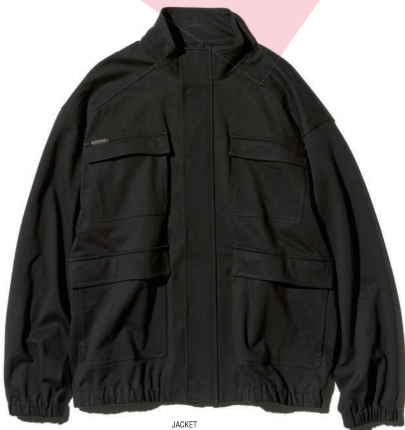
JACKET 02261CJ02 / ¥44,000 BLACK / NAVY / GRAY

みんな大好き、いつの時代も廃れない定番アイテムであるミリタリー。その魅力を保ちつつ、新鮮かつ大人っぽく楽しめるよう提案したいのがブラックという選択。これだけでマンネリ感や土臭さが和らいで、断然シックで都会的、ほんのりモードな印象に早変わり。