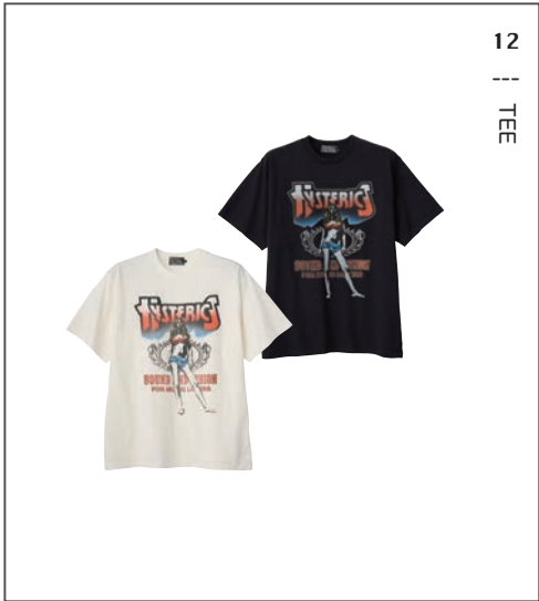
12 || TEE