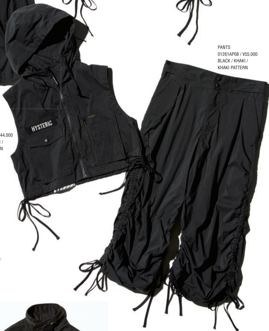
PANTS 01261AP08 / ¥55,000 BLACK / KHAKI / KHAKI PATTERN