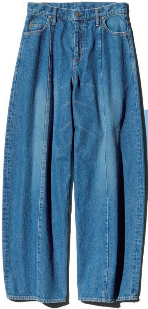
DENIM PANTS 01261AP01 / ¥48,400 INDIGO / BLACK