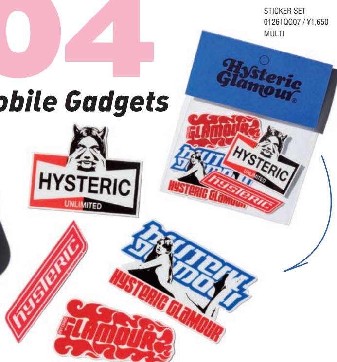
STICKER SET 01261QG07 / ¥1,650 MULTI