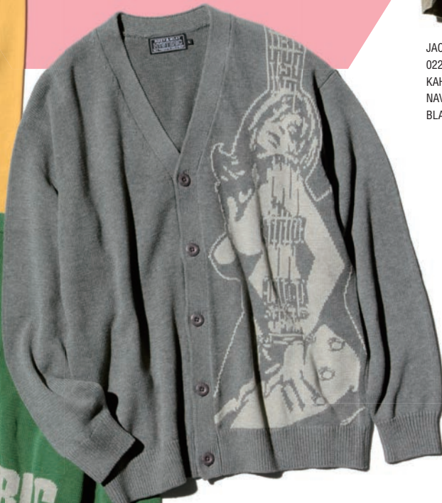
KNIT CARDIGAN 02261ND01 / ¥36,300 GRAY / GREEN / BLACK